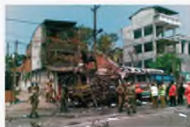
Коломбо, Шри-Ланка, 23 февраля 2008 г.