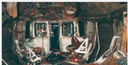
Москва, метро «Автозаводская», 6 февраля 2004 г.

С религиозным терроризмом тесно ассоциирован ряд сепаратистских движений в штате Колорадо (Индия), на Филиппинах, в Чеченской Республике. Примеры – «Аль-Каида», движение «Талибан» (Афганистан), «Батальи мусульман» (Египет), «Абу Сайеф» (Филиппины), «Ансар аль-Ислам» (Ирак), «Асбат аль-Ансар», «Ульма ут-Таджир аль-Ислами» (Ливан), «Аум Синрикё» (Япония) и другие.