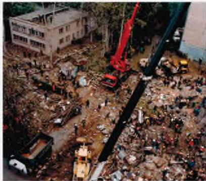
Москва, Каширское шоссе, 13 сентября 1999 г.

Департамент по борьбе с организованной преступностью и терроризмом МВД России