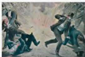
Анише, Франция. 1895 г. Терракт анархиста

В XXI в. просматривается тенденция к расширению масштабов и географии террористической деятельности. Увеличивается число террористических актов, совершаемых с целью личного обогащения. Растет число террористических актов на почве политического противоборства различных сил, а также на почве межэтнических и межконфессиональных противоречий.