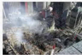
Нью-Йорк, США, 11 сентября 2001 г.

Терроризм по своим масштабам, непредсказуемости и последствиям превратился в одну из наиболее опасных общественно-политических и моральных проблем, с которыми человечество вошло в XXI столетие