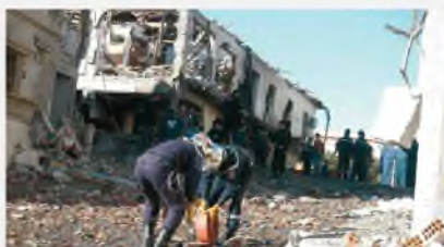
Тенжа, Алжир, 29 января 2008 г.

Националистический терроризм органически связан с сепаратизмом, направленным на изменение существующего государственного устройства, правового статуса национально-государственных или административно-территориальных образований, нарушение территориального единства страны, выход тех или иных территориальных единиц из состава государства, образование собственного независимого государства. Осуществляется организациями этносепаратистской направленности с целью ликвидации экономического и политического диктата национальных государств (например, «Ирландская республиканская армия» (Северная Ирландия), «Рабочая партия Курдистана» (Турция), «Батасуна» – «ЭТА» (Испания), «Фронт национального освобождения Киргизии» (Франция), «Фронт освобождения Каледонии» (Канандя), «Вооруженный союз националистов освобождения» (Пурто-Рико, США), «Тигра освобождения Тамил Ислам» (Шри-Ланка), «УНИТА» (Ангола) и др.).