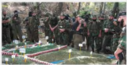
Чеченская Республика, 6 сентября 2002 г.

Субъектами политического терроризма, как правило, выступают радикальные политические партии, отдельные группировки внутри партий или общественных объединений, экстремистские организации, отрицающие легальные формы политической борьбы и делающие ставку на шовинистские дилеммы (например, «Красные бригады» (Италия), «Фронтация красной армии» (Германия), «Аксон директ» (Франция), «Японская красная армия» (Япония), «эскадроны смерти» в Латинской Америке и др.).