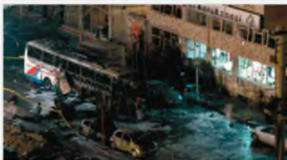
Диярбакыр, Турция, 1 марта 2008 г.

Кибертерроризм представляет серьезную угрозу для человечества, сравнимую с ядерным, бактериологическим и химическим оружием, причем степень этой угрозы в силу своей новизны до конца еще не осознана и не изучена.