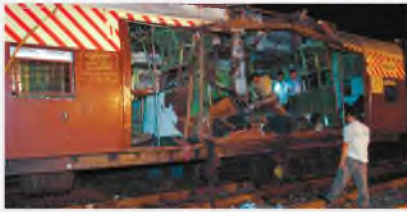
Мумбаи, Индия, 11 июля 2008 г.

Политическая организация, взявшая на вооружение террористические методы борьбы, со временем перерождается в преступную группировку, прикрывающуюся политическими лозунгами.