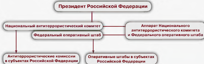
Схема координации противодействия терроризму в Российской Федерации

Важнейшим инструментом антитеррористической политики является осведомленность, то есть знание и готовность к действиям в чрезвычайной ситуации